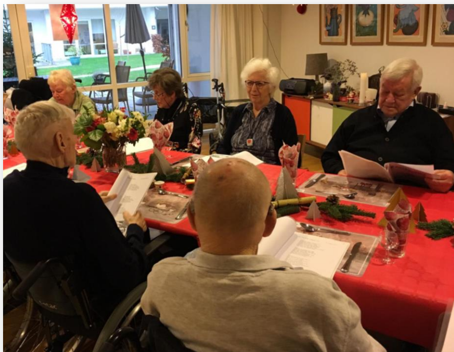
Luciaoptog på afd. G