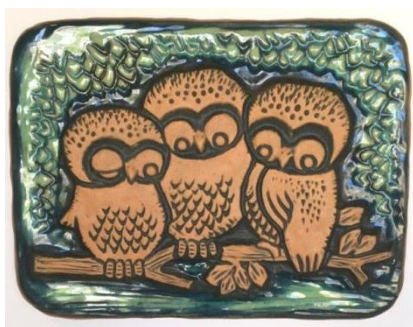
4 Keramik-billede ved huskekasserne, gangareal stuen