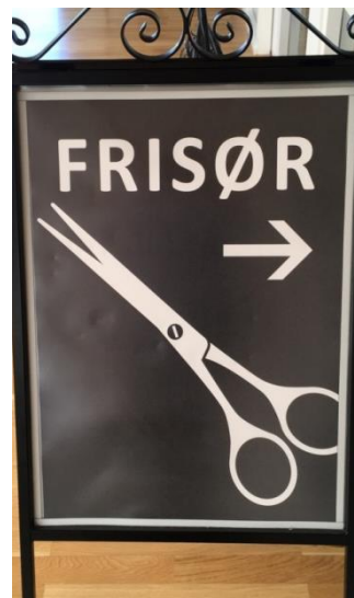
6 Skilt uden for frisørsalonen