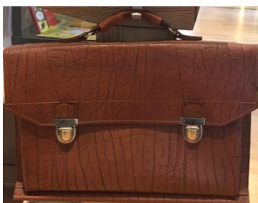
5 Skoletaske ved skolepult uden for aktivitetscentret