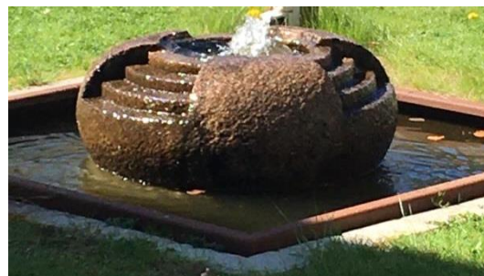
3 Springvand i havearealet mellem afd. G og afd. H