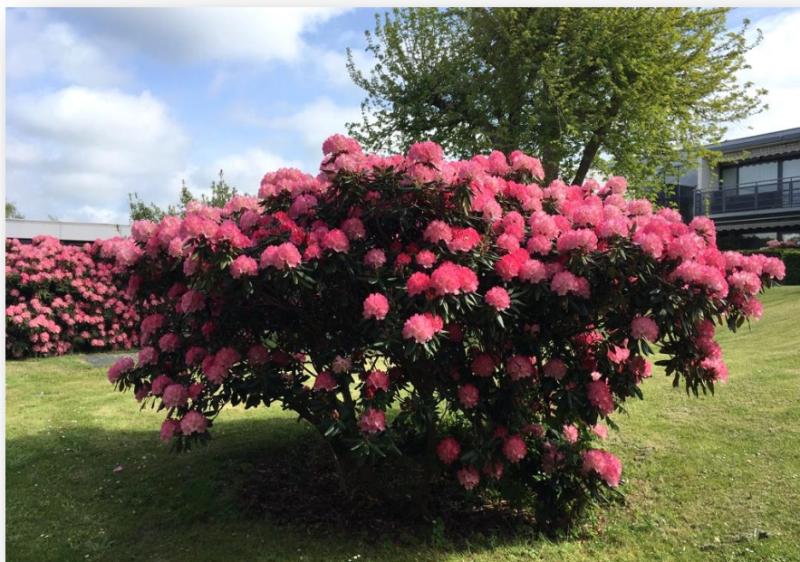
De smukke rhododendron ved seniorboligerne står i fuldt flor