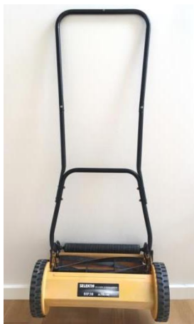
1 Græsslåmaskine gangareal 1. sal