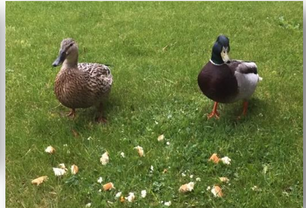
Andemor og andefar på morgenvisit på afd. I.