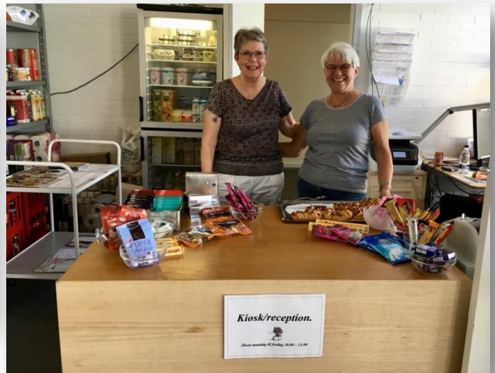
Mens receptionsområdet bygges om, er der højt humør i den midlertidige kiosk