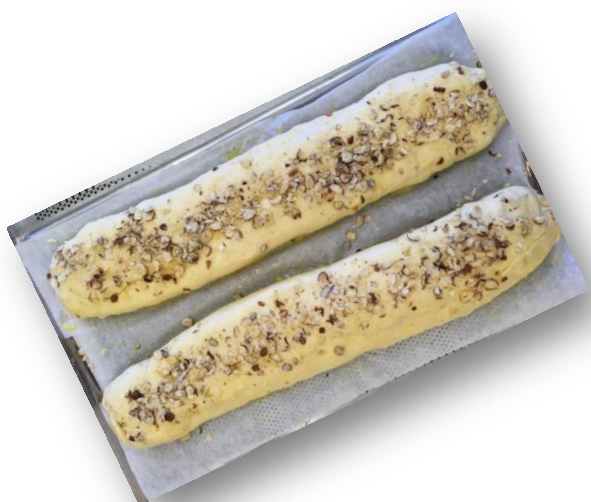
Storproduktion af lækker mormorkringle