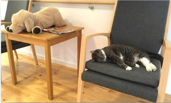
Afd. K's husdyr sover ☺