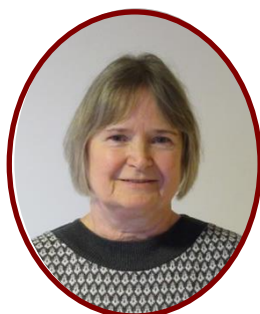
Pia Jelle Pårørende afd. I