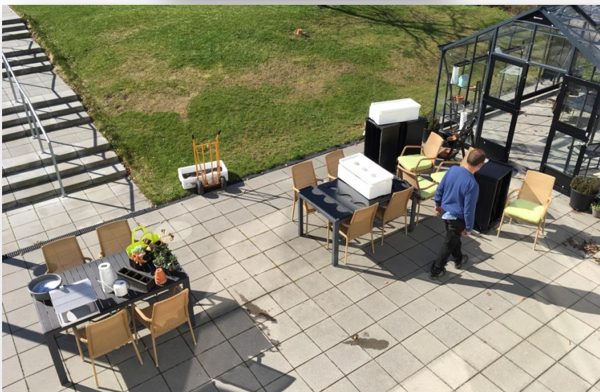
Forårsrengøring i drivhuset