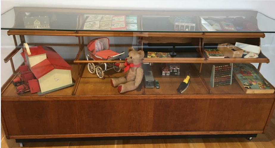
Legetøjsudstilling – på forbindelsesgangen 1. sal ud for afd. I